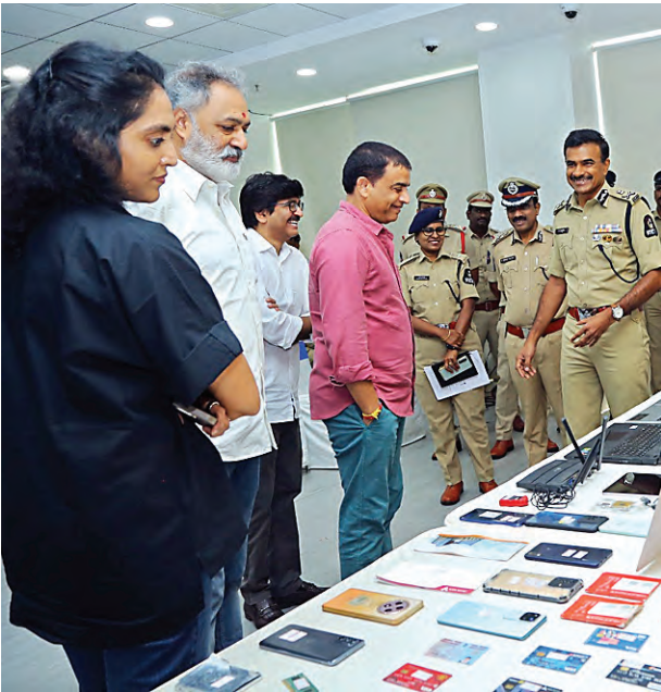
हैदराबाद, 29 सितम्बर (स्वतंत्र वार्ता)। हैदराबाद साइबर अपराध पुलिस ने एक परिष्कृत फिल्म पायरेसी रैकेट का भंडाफोड़ किया

पाँच गिरफ्तार, अन्य को नोटिस, तेलुगु फिल्मों की ऑनलाइन चोरी रोकी जाएगी